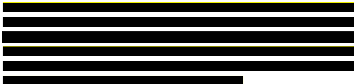
Tabela 3. Wyniki analizy racjonalizacyjnej (PLN)